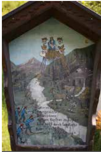
Bildstöckl am Platz der alten Rohrer Mühle

In der Nähe des Weilers Rohr bei Zell am Ziller steht in einem dichten, kühlen Buchenwalde eine uralte Mühle. Sie ist längst von allen Menschen verlassen und keine Seele wagt es, auch nur in ihre Nähe zu kommen.