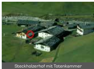
Steckholzerhof mit Totenkammer

Der Marsch vom Tuxertal nach Mauern war aber gar nicht an einem Tag zu schaffen, deshalb wurden die Toten in Schmirn im Weiler Oberrn beim Steckholzerbauern deponiert. In diesem Hof war bergseitig eine kleine kalte Kammer (siehe Markierung), in der die Leichen für eine Nacht „zwischengelagert“ wurden. Am nächsten Tag ging es dann weiter talauswärts bis nach Steinach-Mauern.