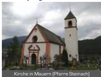
Kirche in Mauern (Pfarre Steinach)

Tux am Friedhof in Mauern, einer der ältesten Begräbnisstätten des Wipptales (1201 erstmals erwähnt) begraben.