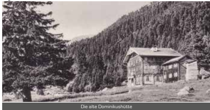
Die alte Dominikushütte