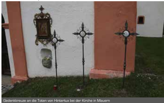
Gedenkkreuze an die Toten von Hintertux bei der Kirche in Mauern